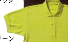
24 アップルグリーン

商品に関するお問合せは tel 03-3352-5435 fax 03-3352-5990 E-mail info@roche.co.jp