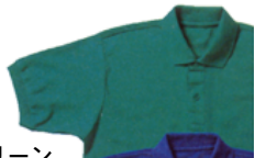
4 エメラルドグリーン